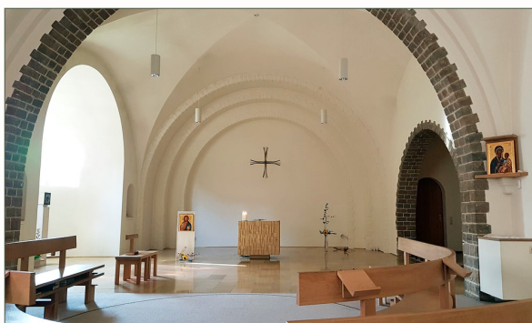
La chapelle du monastère

MONASTÈRE d'HURTEBISE 6870 Saint-Hubert, Belgique Site : https://www.hurtebise.eu/ 00 32 (0)61.61.11.27